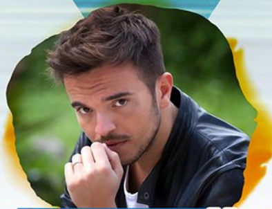
Andrea SANNINO un Mare di Abbracci