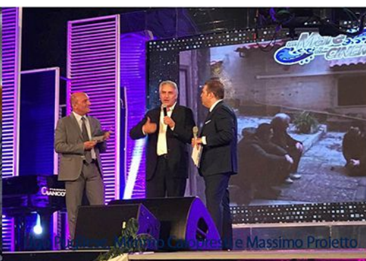
Massimo Proietto e Milly Carlucci