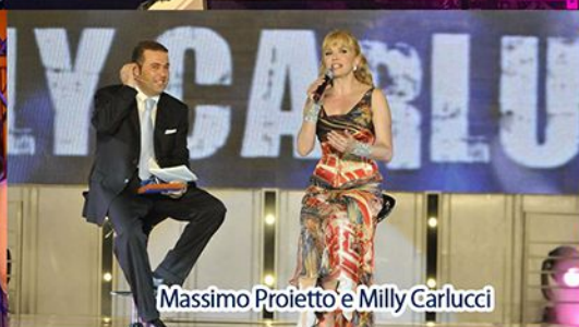
Massimo Proietto e Milly Carlucci