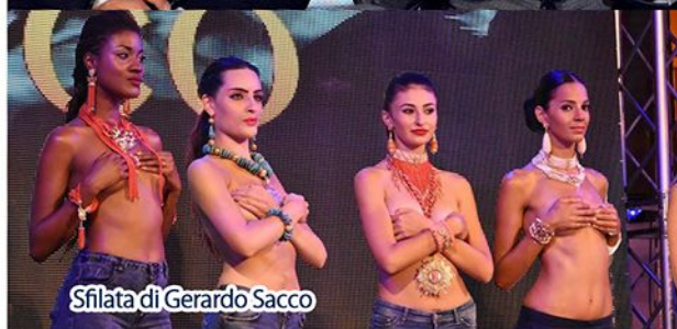
Sfilata di Gerardo Sacco