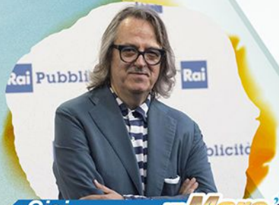
Gigi MARZULLO un Mare di Giornalismo e Televisione