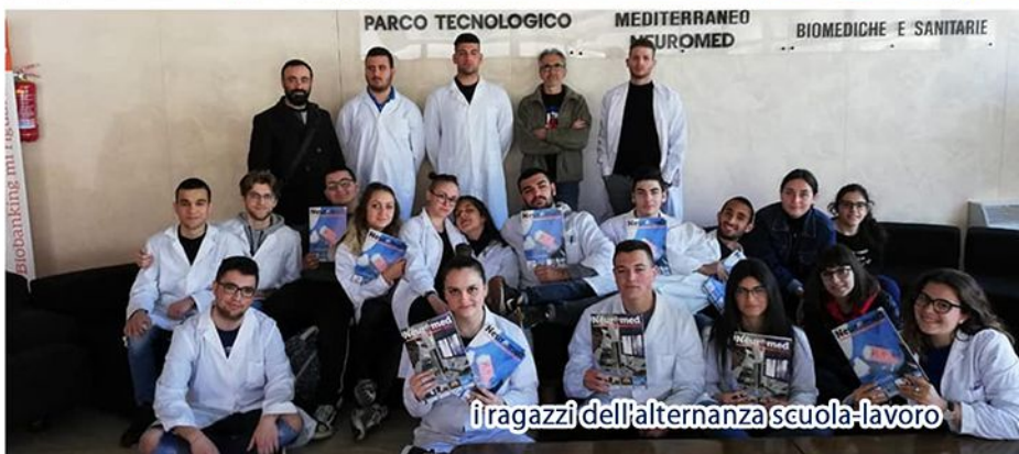
i ragazzi dell'alternanza scuola-lavoro