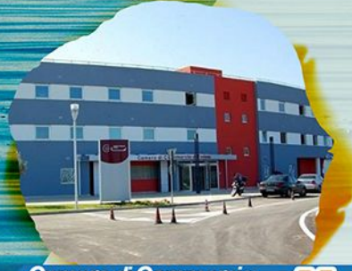
Camera di Commercio Crotona un Mare di IMPEGNO