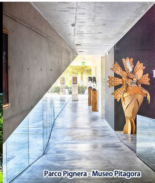
Parco Pignera - Museo Pitagora