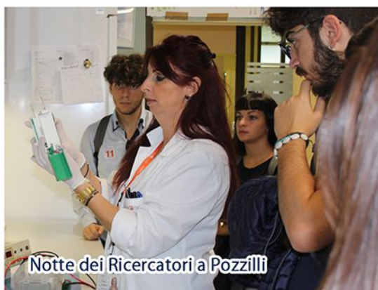
Notte dei Ricercatori a Pozzilli